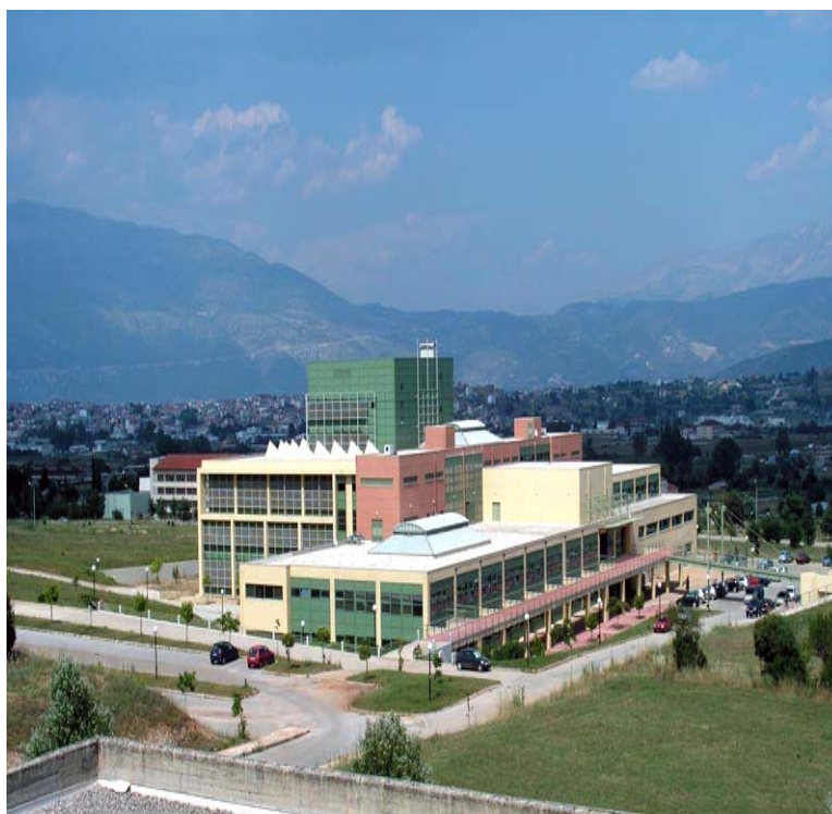
Πανοραμική άποψη της Κεντρικής Βιβλιοθήκης του Παν/μίου Ιωαννίνων